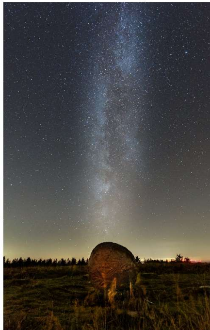
Le Buveur d'Air !