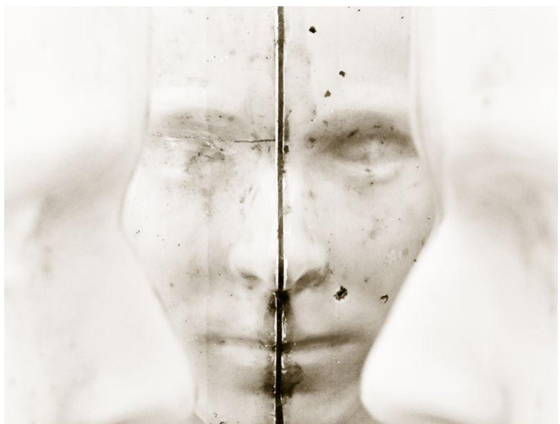
"Domination" de Dominique Eckenfels - Médaille Divers